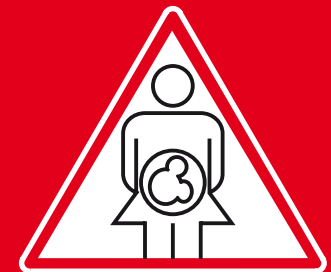
Anya a gyermekekre (szülés, szoptatás)