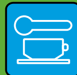
Jíst & pít spolu