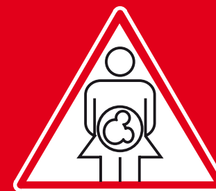
От матери ребёнку (рождение, кормление)