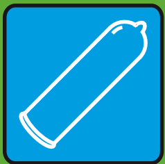
Секс с презервативом