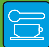
Вместе есть и пить