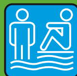
Ванная и сауна