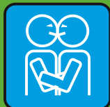
Поцелуи и Объятия