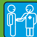
Врач и уход за больными

РИСК · ОПАСНОСТЬ · РИСК · ОПАСНОСТЬ · РИСК... ...у Кровь · Сперма · Выделения · Материнское молоко