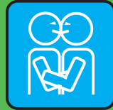
baci & abbracci