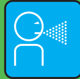
tossire & starnutire