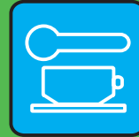
mangiare & bere insieme