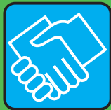
stringere le mani

NESSUN RISCHIO · NESSUN PROBLEMA · NESSUN RISCHIO · NESSUN PROBLEMA