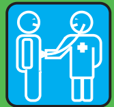
medico & prestazioni infermieristiche

RISCHIO · PERICOLO · RISCHIO · PERICOLO · RISCHIO · PERICOLO... ...con sangue · sperma · secrezione vaginale · latte materno