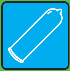
secco con profilattico